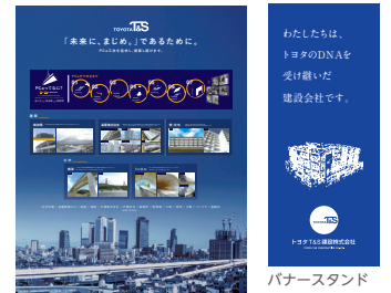
◀トヨタ T&S 建設様