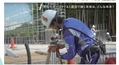
▼トヨタ T&S 建設様