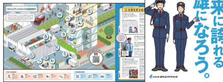
▶トヨタエンタプライズ (セキュリティ)