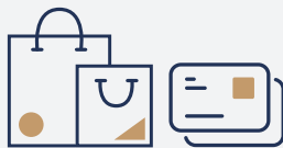
企業ステーションナリー