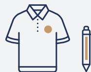
ノベルティ・グッズ